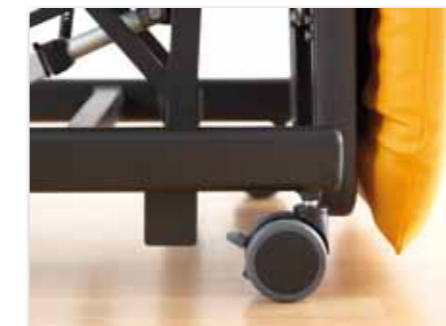
Mehr Flexibilität: Die SlimLine ist mit vier einzeln gebremsten Rollen mit einem Durchmesser von 7,5 cm ausgestattet.