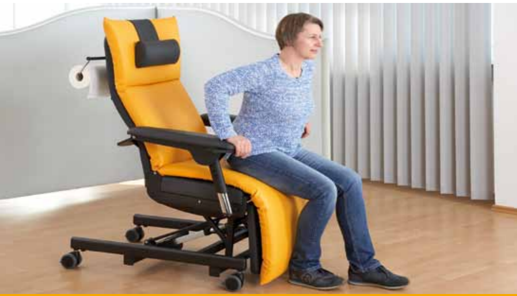
Der einfache Ein- und Ausstieg von vorne wird durch die niedrige Sitzhöhe von nur 57,5 cm, durch das rechtwinklig einstellbare Beinteil und die ideale Sitzneigung ermöglicht.