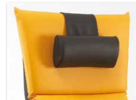
Die Nackenrolle sorgt für mehr Komfort und kann durch das Gegengewicht besonders leicht und individuell eingestellt werden.

Für eine Anpassung der SlimLine an Ihr Raum- und Farbkonzept kann die gewünschte Polsterauflage aus über 30 Farben ausgewählt werden. Das Grundgestell, die Armlehnen und die Nackenrolle sind immer in Anthrazit ausgeführt.