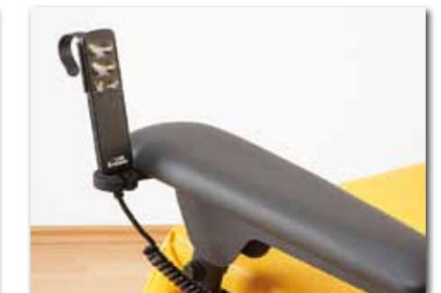
Der bildierte Handschalter verfügt über zwei vorprogrammierte Tasten. Serienmäßig ist an jeder Armlehne ein gut erreichbarer Halter für den Handschalter angebracht.