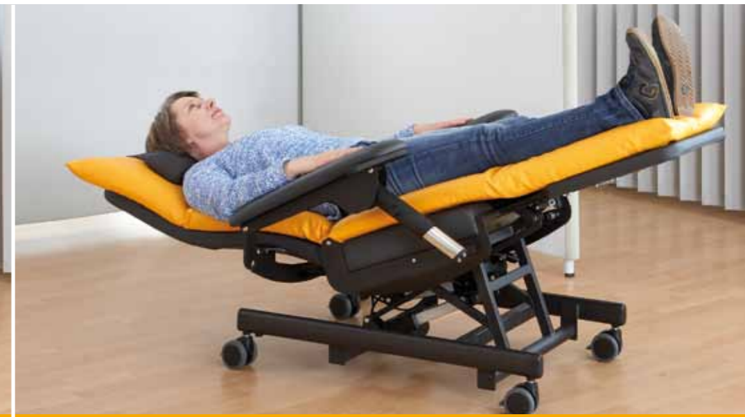
Für den Notfall kann die SlimLine per Knopfdruck in eine Kopf-Tief-Lage gestellt werden. Das stabile Grundgestell bietet hierfür, trotz geringem Raumbedarf, die nötige Standsicherheit.

Die SlimLine Therapieliege wurde speziell für die Anforderungen in Ihrer onkologischen Tagesklinik oder der Infusionstherapie entwickelt. Auch in kleinen Räumen sorgt die schmale und leichte Liege mit ihren zwei Motoren für die nötige Flexibilität und den hohen Komfort, um Ihren Patienten die Dauer der Behandlung so angenehm wie möglich zu gestalten.