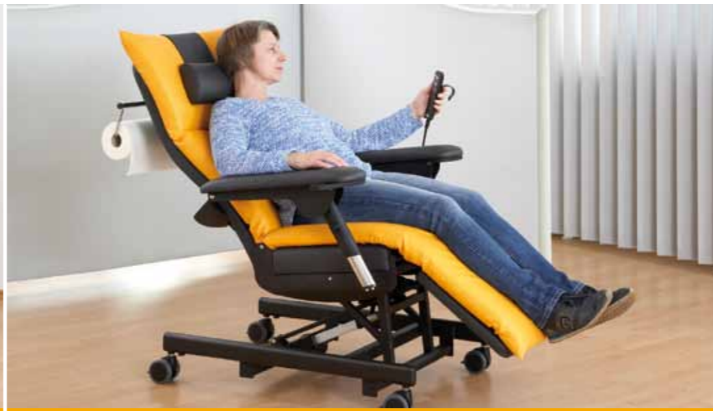
Die SlimLine Therapieliege wurde speziell für den Einsatz in der Infusionstherapie entwickelt und kann mit Hilfe von zwei Motoren schnell und einfach in eine bequeme Komfortposition gebracht werden.