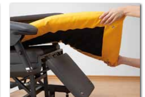
Die abnehmbare und leicht zu reinigende Matratzenauflage sorgt zusammen mit der Unterpolsterung für langanhaltenden Komfort.