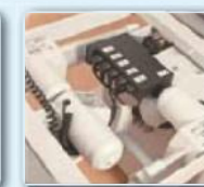
Leicht zugänglich unter dem Sitzteil – die vier Motoren