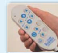
Nutzerfreundlicher Handschalter zur Einstellung der gewünschten Position

Die farbliche Anpassung an die Einrichtung Ihrer Station ist durch die verschiedenen Farben sowie das moderne Bi-Color Design möglich.