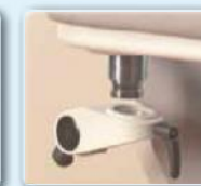
Flexibel auch in engen Räumen durch abnehmbare Armlehnen