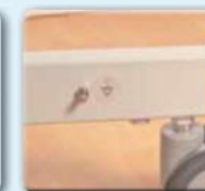
Mehr Patientensicherheit durch den Potentialausgleich am Untergestell