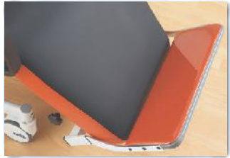
Die manuell verstellbare Fußstütze erhöht den Komfort in der Sitzposition.