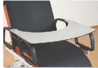
Der Patiententisch wird einfach und stabil auf die Seitensicherungen geklemmt.