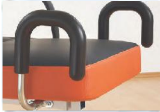
Mit zusätzlichen Griffen kann die Liege vom Fußende manövriert werden.