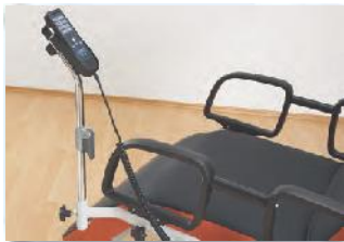
Mit der Aufnahme für den Handschalter haben Sie einen schnellen Zugriff auf die übersichtliche Bedienung.