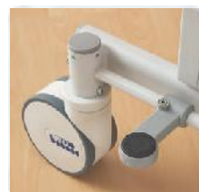
Die 12,5 cm großen Rollen sind mit Richtungsfeststeller für einfaches Fahren und Zentralbremse für sicheres Positionieren der Liege ausgestattet.