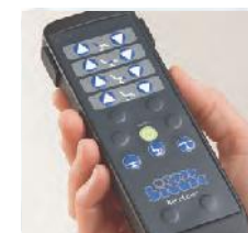
Die drei wichtigsten Positionen sind im Handschalter vorprogrammiert. Für eine Feinabstimmung und weitere Positionen sind zusätzliche Tasten vorhanden.