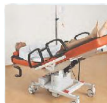
Die Schockposition kann einfach durch einen roten Fußtaster beidseitig aktiviert werden. Dem Pflegepersonal bleiben somit die Hände frei.