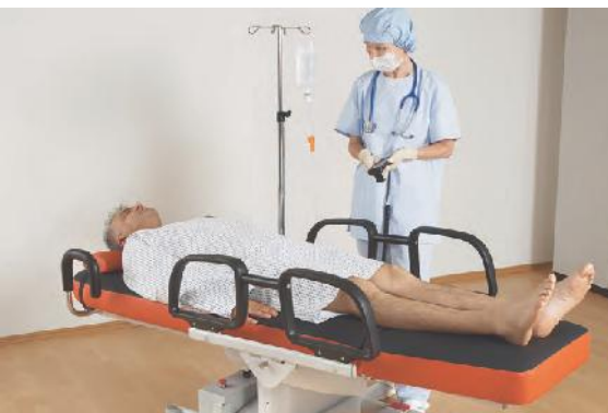
Einfaches Umbetten Ihrer Patienten vom OP-Tisch auf die RecoLine + durch elektrische Höhenverstellung