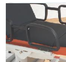
Die Seitensicherungen können teilweise oder komplett abgeklappt werden, um den Einstieg sowie das Umlagern zu erleichtern.