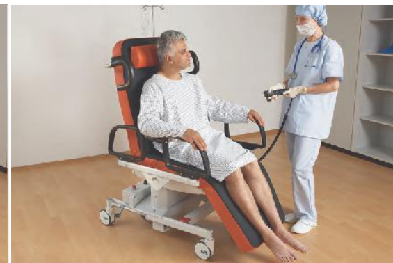
Aufrechte Sitzposition für ein einfaches Aus- und Einsteigen nach der ambulanten OP

Die RecoLine + Therapieliege ist eine Weiterentwicklung für die Versorgung von Patienten während und nach ambulanten Operationen. Sie wurde auf Basis umfangreicher Erfahrungen speziell für die Bedürfnisse der Patienten und des Pflegepersonals neu entwickelt – für mehr Komfort und Flexibilität im Aufwachraum.