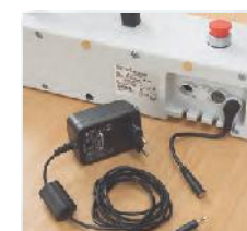
Der Akkumulator wird über ein Ladekabel einfach an der Steckdose aufgeladen und garantiert einen netzunabhängigen Betrieb von mehreren Tagen.