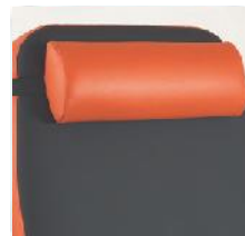
Das bequeme Kopfkissen sorgt für eine angenehme Liegeposition und kann je nach Größe des Patienten positioniert werden.