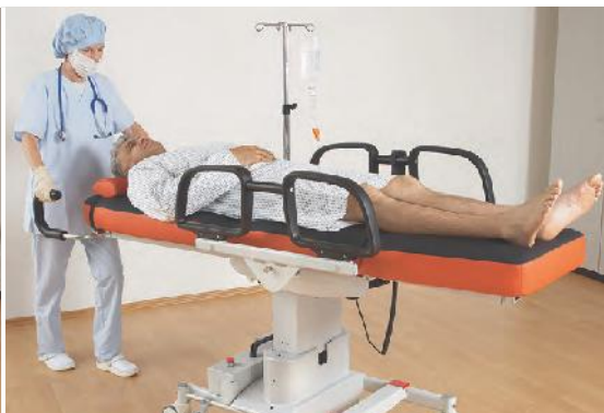
Vorprogrammierte Einstellungen per Knopfdruck für leichtes Manövrieren oder die weitere Behandlung