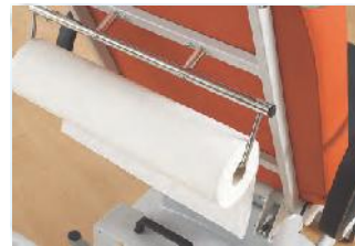
Der Papierrollenhalter dient zur Aufnahme von Papierrollen für mehr Hygiene.