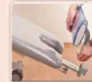
Elektrisch verstellbare Fußstütze für eine entspanntere Sitzposition, auch einfach abnehmbar