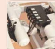
Fünf Motoren – servicefreundlich unter dem Sitzteil positioniert