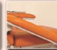
3-dimensional einstellbare Armlehnen zur optimalen Lagerung der Arme