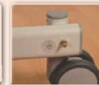
Potentialausgleich gemäß EN 60601 für Patientensicherheit