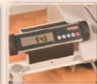
Integrierte Waage für die Dialyse – zur Überwachung des Patientengewichts