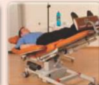
Schockposition beidseitig per Fußpedal schnell aktivierbar