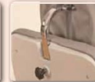
Höhenverstellbares Kopfteil für individuellen Komfort