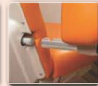
Hochklappbare und abnehmbare Armlehnen für maximale Flexibilität