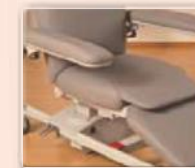
Optionaler Tiefeinstieg für den leichteren Einstieg aus dem Rollstuhl