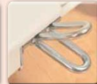
Zentralbremse auf beiden Seiten zur schnellen Fixierung aller vier Rollen