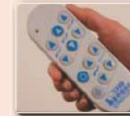
Handschalter zur individuellen Bedienung aller Sitz- und Liegepositionen

Die ComfortLine kann nach Bedarf als Variante mit Tiefeinstieg oder mit integrierter Waage geliefert werden.